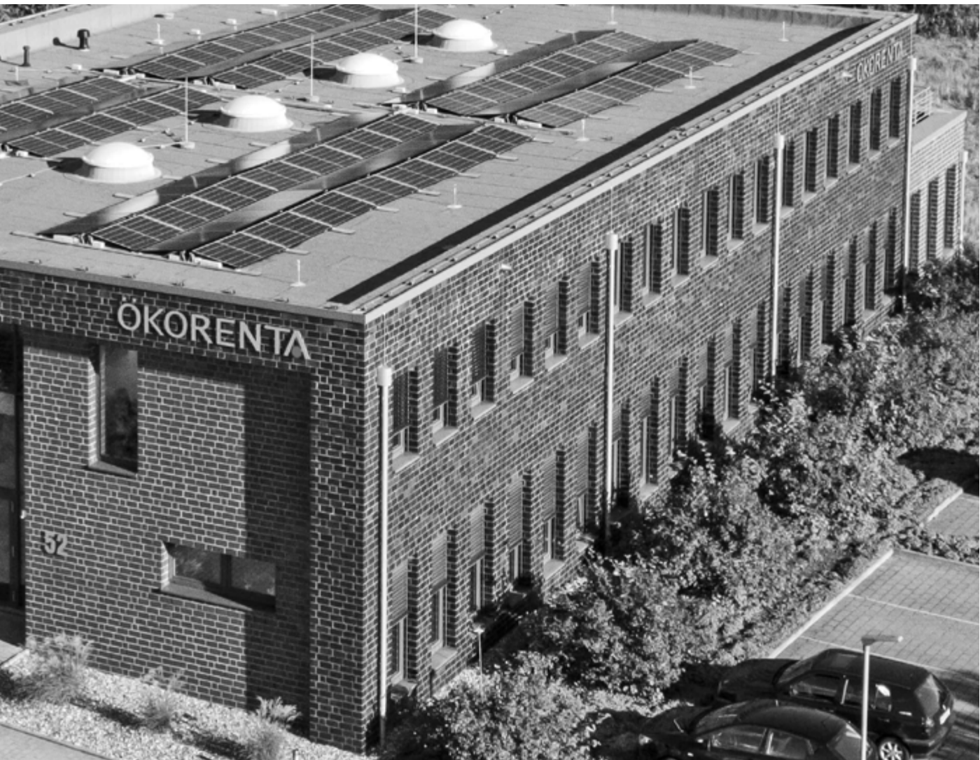
ÖKORENTA Firmengebäude am Hauptsitz in Aurich, Ostfriesland