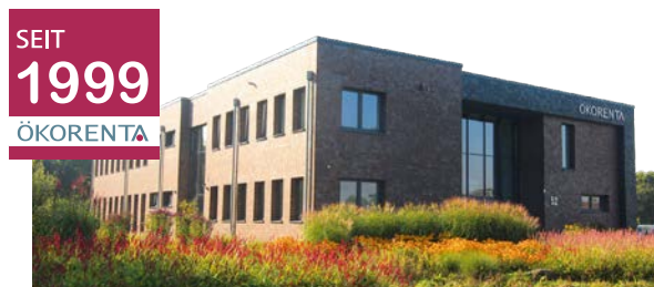
ÖKORENTA-Firmengebäude in Aurich, Ostfriesland

Zum Zeitpunkt der Auflage des Fonds sind weder Vermögensgegenstände erworben, noch stehen konkrete Vermögensgegenstände fest. Sie können sich vor der vertraglichen Bindung an die Fondsgesellschaft insofern kein vollständiges Bild über die Vermögensgegenstände und die damit verbundenen Risiken und Ertragschancen verschaffen. Anleger:innen gehen mit einer Beteiligung eine langfristige Verpflichtung ein - eine Veräußerung an Dritte ist nicht sichergestellt. Für eine vollständige Darstellung der Risiken sollten sie die Risikohinweise im Verkaufsprospekt vom 22. Juli 2022 im Kapitel „Risiken“ lesen. Der Verkaufsprospekt und die „Wesentlichen Anlegerinformationen“ sind kostenlos in elektronischer Form auf unserer Website unter www.oekorenta.de/downloads und in gedruckter Form in deutscher Sprache bei der Auricher Werte GmbH, Kornkamp 52, 26605 Aurich oder bei Ihrem Berater erhältlich.